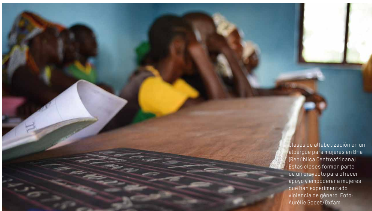
Clases de alfabetización en un albergue para mujeres en Bria (República Centroafricana). Estas clases forman parte de un proyecto para ofrecer apoyo y empoderar a mujeres que han experimentado violencia de género.

LOS GOBIERNOS DEBEN REESCRIBIR LAS REGLAS DE SUS ECONOMÍAS QUE GENERAN ESTAS ENORMES DIVISIONES, Y ACTUAR PARA PREDISTRIBUIR MEJOR LOS INGRESOS, TRANSFORMAR LAS LEYES Y REDISTRIBUIR EL PODER EN LA TOMA DE DECISIONES Y LA PARTICIPACIÓN EN LA ECONOMÍA.