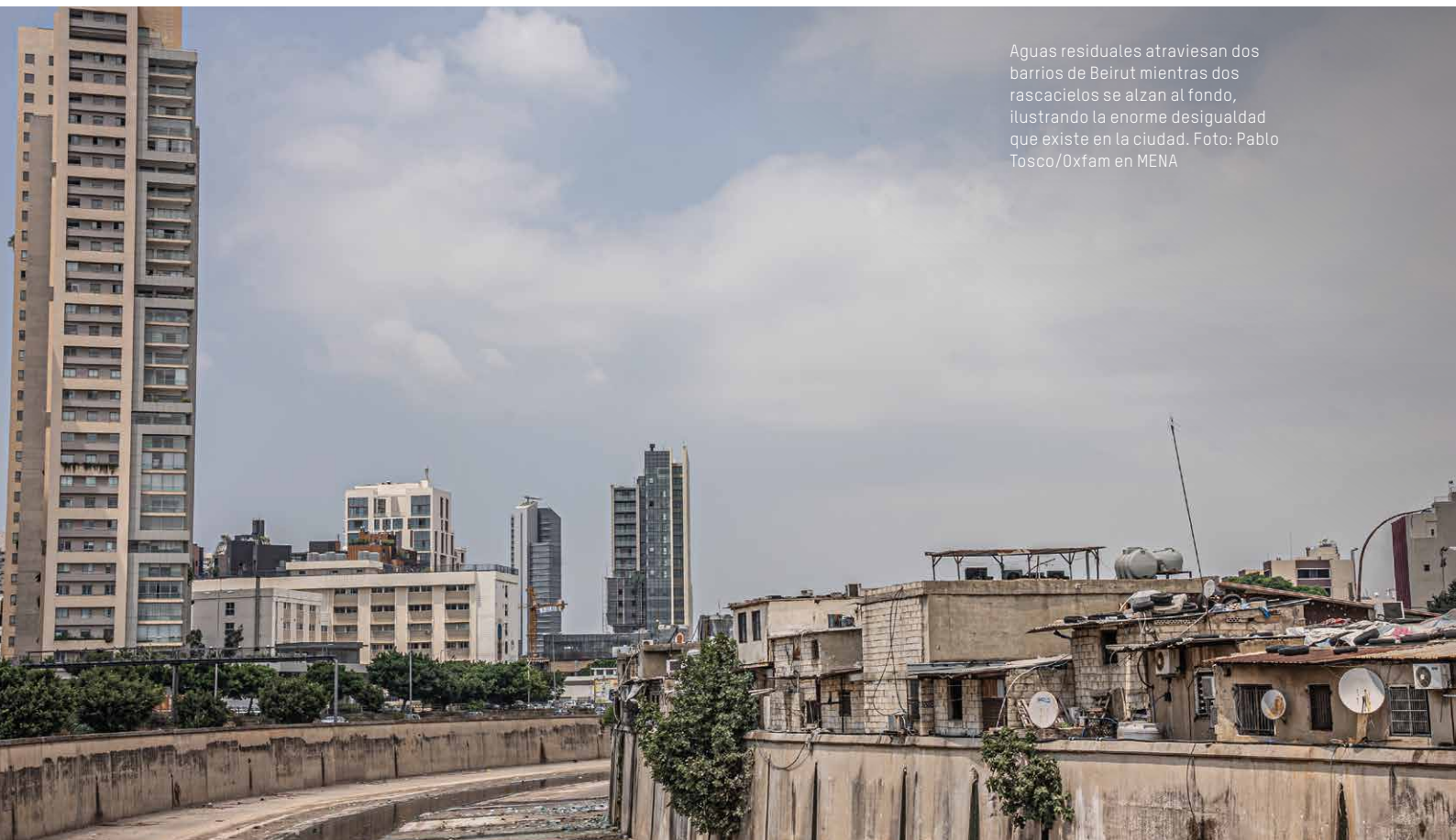
Aguas residuales atraviesan dos barrios de Beirut mientras dos rascacielos se alzan al fondo, ilustrando la enorme desigualdad que existe en la ciudad.

Los Gobiernos tienen un gran margen de maniobra para cambiar radicalmente el rumbo. Solo aplicando soluciones sistémicas podremos combatir la violencia económica desde su origen y establecer las bases de un mundo más justo. Esto requiere una transformación ambiciosa de las reglas que rigen la economía con el fin de redistribuir de una manera más justa el poder y los ingresos (empezando por garantizar que los mercados, el sector privado y la globalización no generen una mayor desigualdad), haciendo que los ricos tributen lo que les corresponde justamente e invirtiendo en medidas públicas de eficacia demostrada.