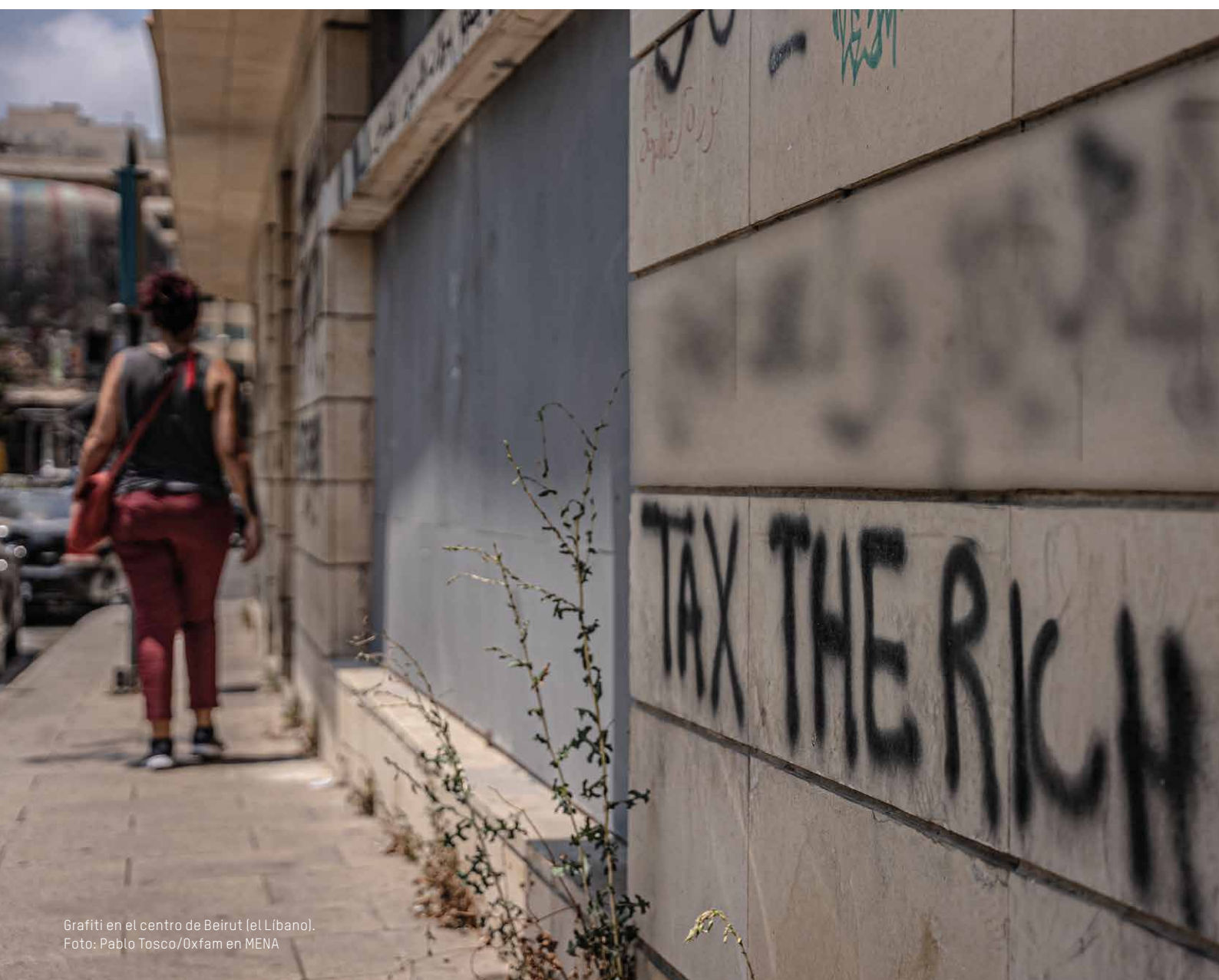
Grafiti en el centro de Beirut (el Líbano).

Podemos hacer que el mundo sea un lugar mejor. Solo tenemos que encontrar la voluntad política para tomar las medidas necesarias.